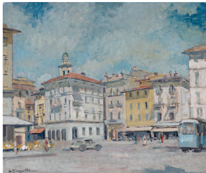
Piazza della Riforma, 1950. Cantone Ticino