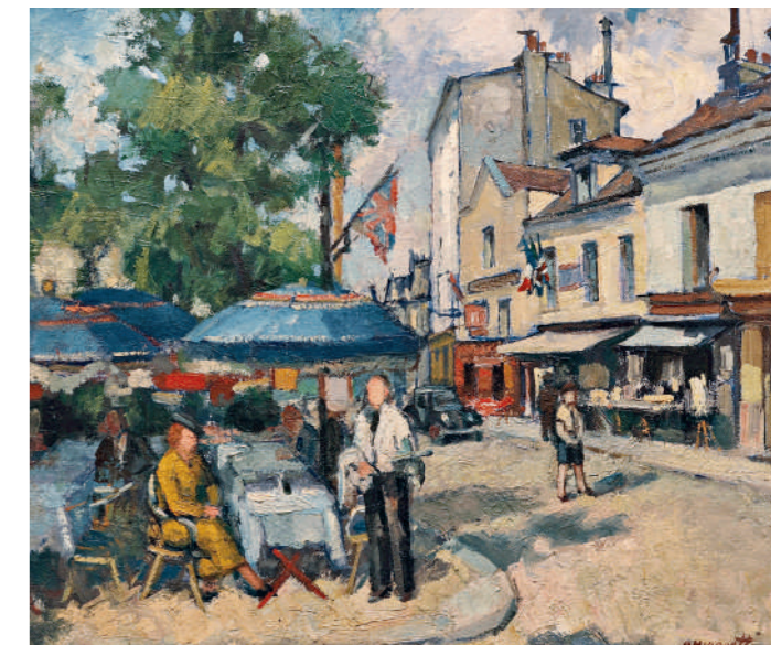
Montmartre, Place du Tertre, circa 1930.